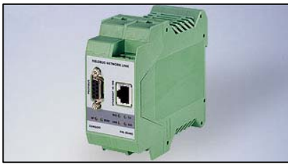
FNL – DP