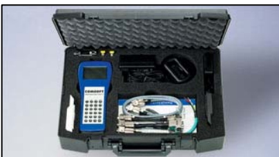
NetTEST II Service-Koffer