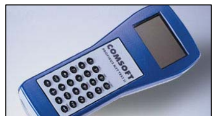
NetTEST II Handheld